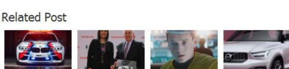
BMW M2 MotoGP Safety Car | Nissan Mexicana, patrocinador oficial del Comité O... | Los padres del actor Anton Yelchin demandan a Fiat... | Volvo, gana "Car Design Awards" 2016 (...)

2016 | CHRYSLER | PACIFICA | TOP SAFETY PICK+