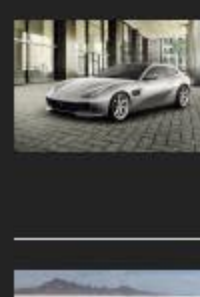
Ferrari GTC4Lusso T: la variante V8 biturbo y 610 CV | 22 septiembre, 2016