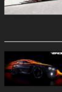
Honda rompe record de velocidad superando los 421 km/h | 22 septiembre, 2016