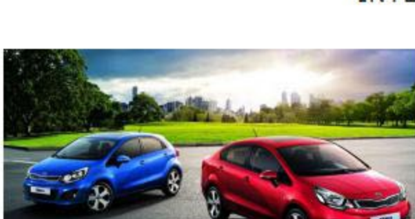
EL NUEVO KIA RIO LLEGA AL MERCADO MEXICANO | 18 enero, 2016