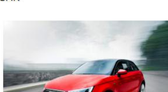
#ADTEST AUDI A1 S-LINE | 10 enero, 2016