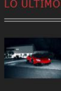
Novitec Torado le da un aspecto agresivo al Lamborghini Huracán | 22 septiembre, 2016